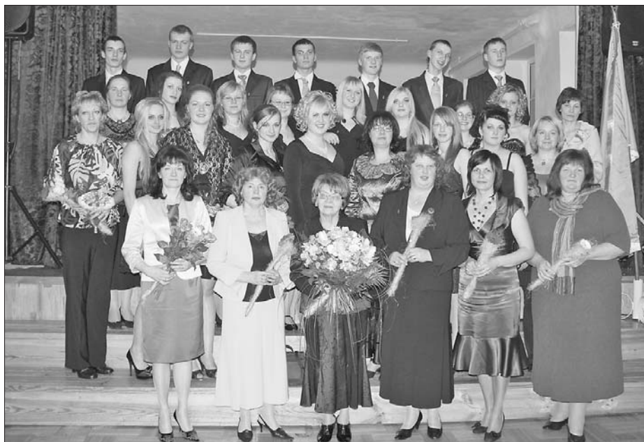
Viļakas Valsts ģimnāzijas 12. klase

Par to, ko kāro un cer darīt pēc 12. klases absolvēšanas, jautājām Viļakas Valsts ģimnāzijas un Rekasas vidusskolas pēdējās klases skolēniem.