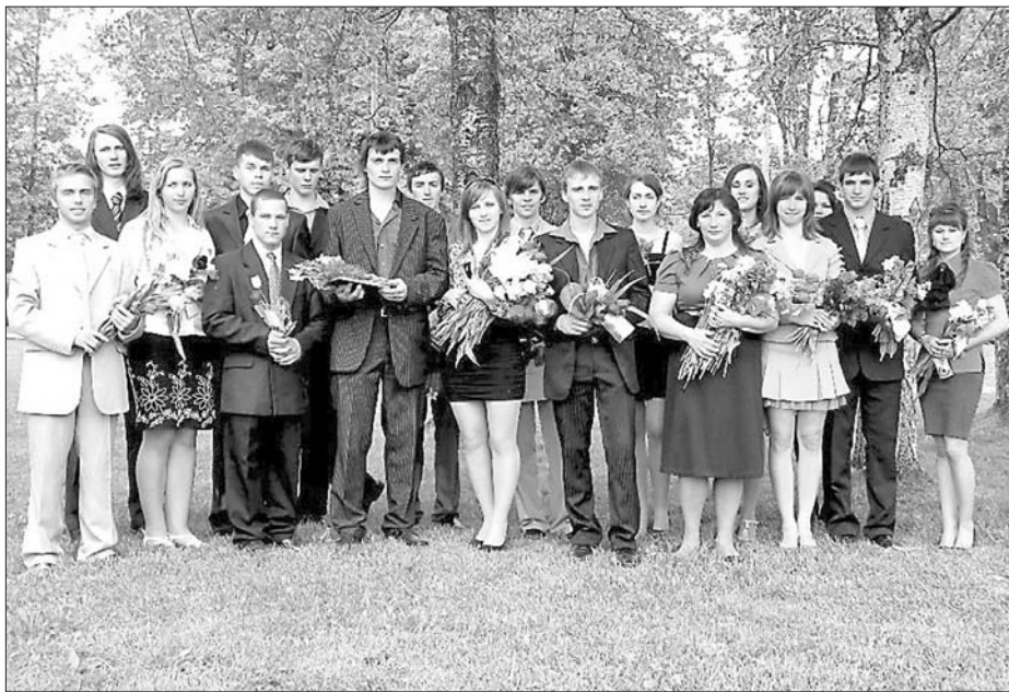
Rekasas vidusskolas 12. klase